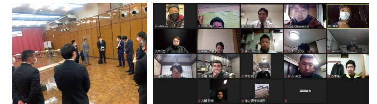
理事・役員予定者との顔合わせ会及び、新会員研修オリエンテーションの様子